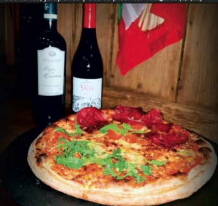
"PIZZA LEONA acompañada de vino: Pagos de Quintana "Rivera" y Baltos "Bierzo".