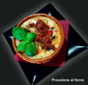
Provolone al forno