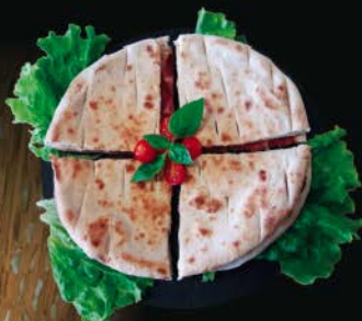
*Pizze Bianche, IL PIADONE.