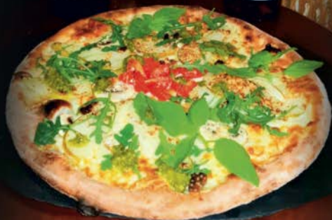
*Pizze Bianche DELIZIOSA, acompañada de vino: El Aprendiz, Prieto Picudo®.