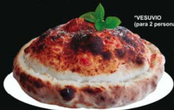
*VESUVIO (para 2 personas).