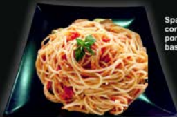
Spaghetti con salsa pomodoro e basilico.

ARRABIATA Tomate natural y guindilla. Alérgenos (1,3,12) 10,00 €